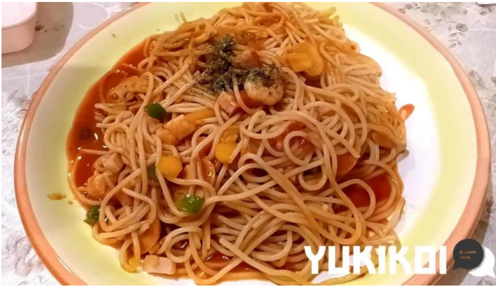
くちなし亭 スパゲッティ