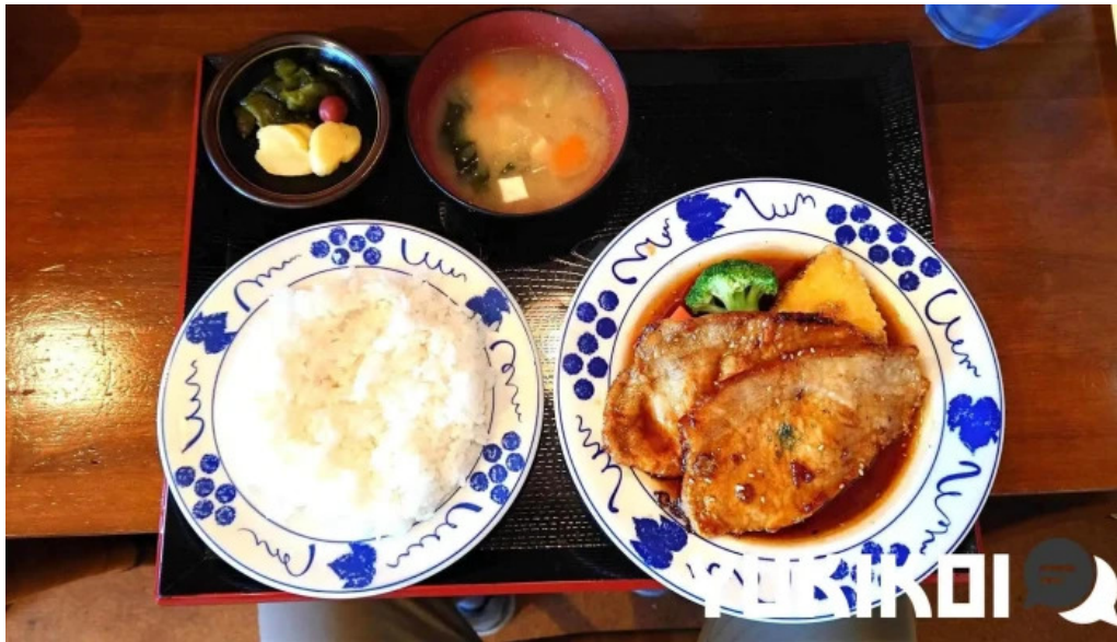
くちなし亭 料理飲み物