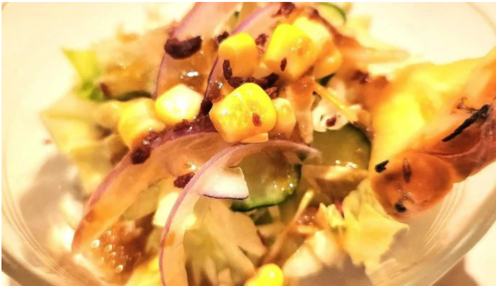
くちなし亭 スコア