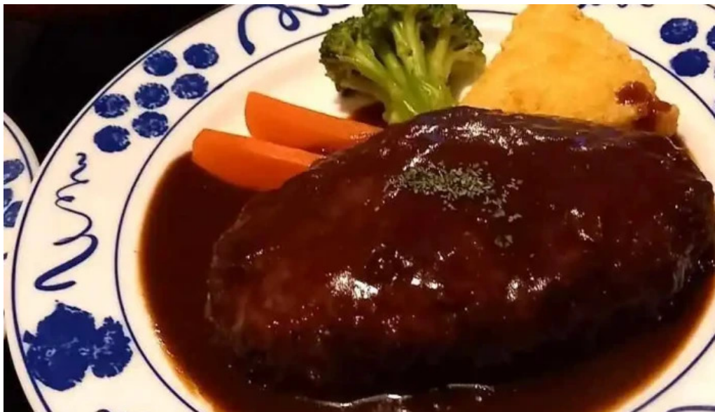
くちなし亭 スープ