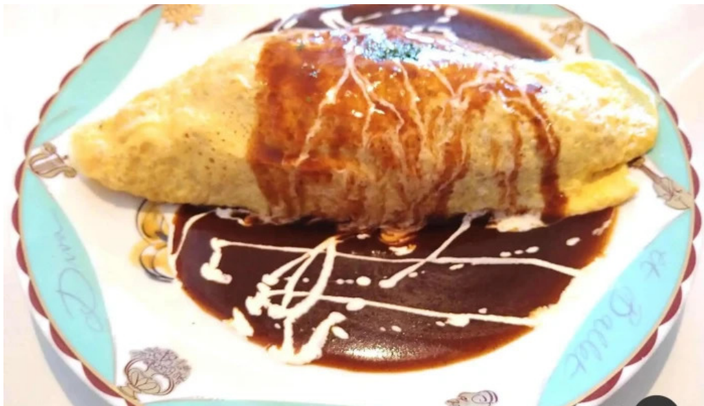
くちなし亭 オムライス