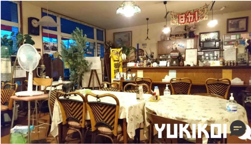
くちなし亭 雰囲気