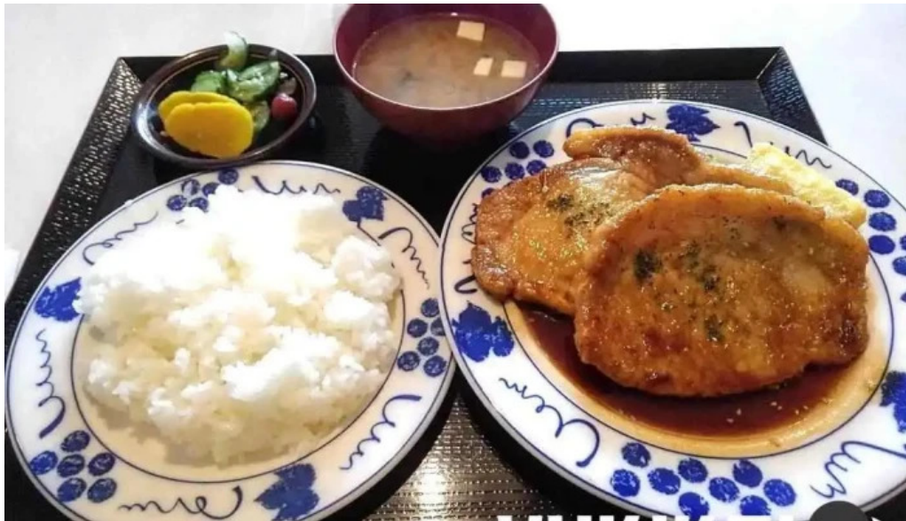
くちなし亭 カレー