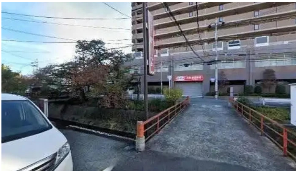
めい山季節一品料理 柏原市