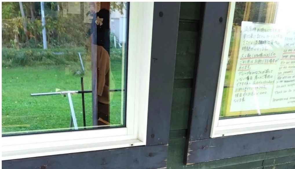
おうどんcafe 寶月 ホウツキ プロモーション