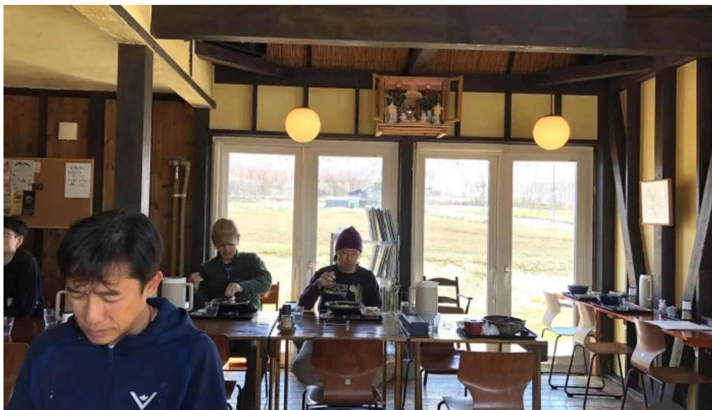
おうどんcafe 寶月 ホウツキ 雰囲気