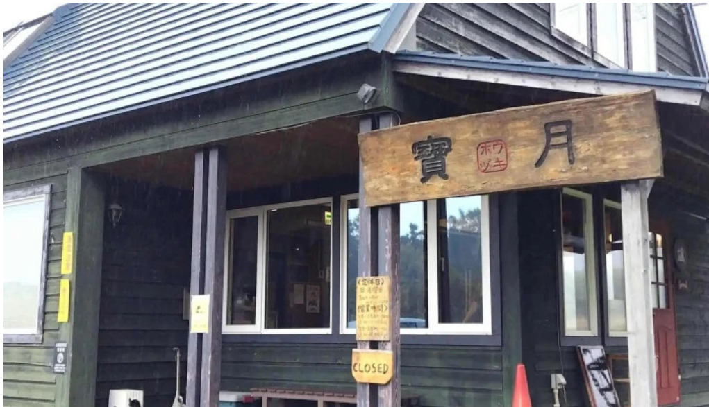
おうどんcafe 寶月 ホウツキ どこ