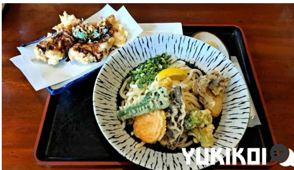
おうどんcafe 寶月 ホウツキ 天ぷら