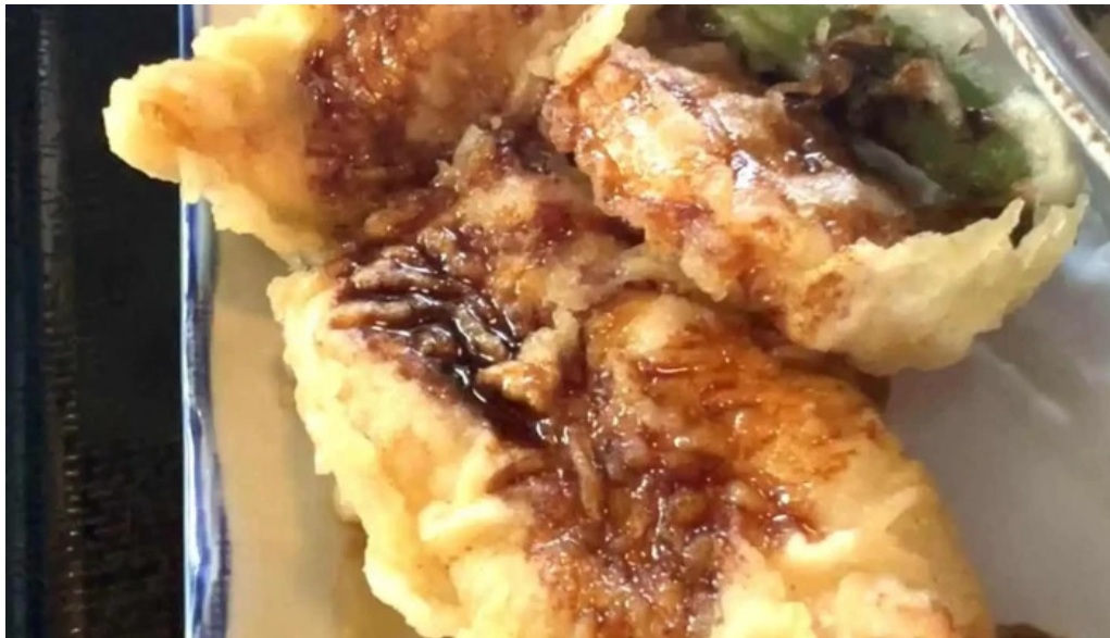
おうどんcafe 寶月 ホウツキ 動画