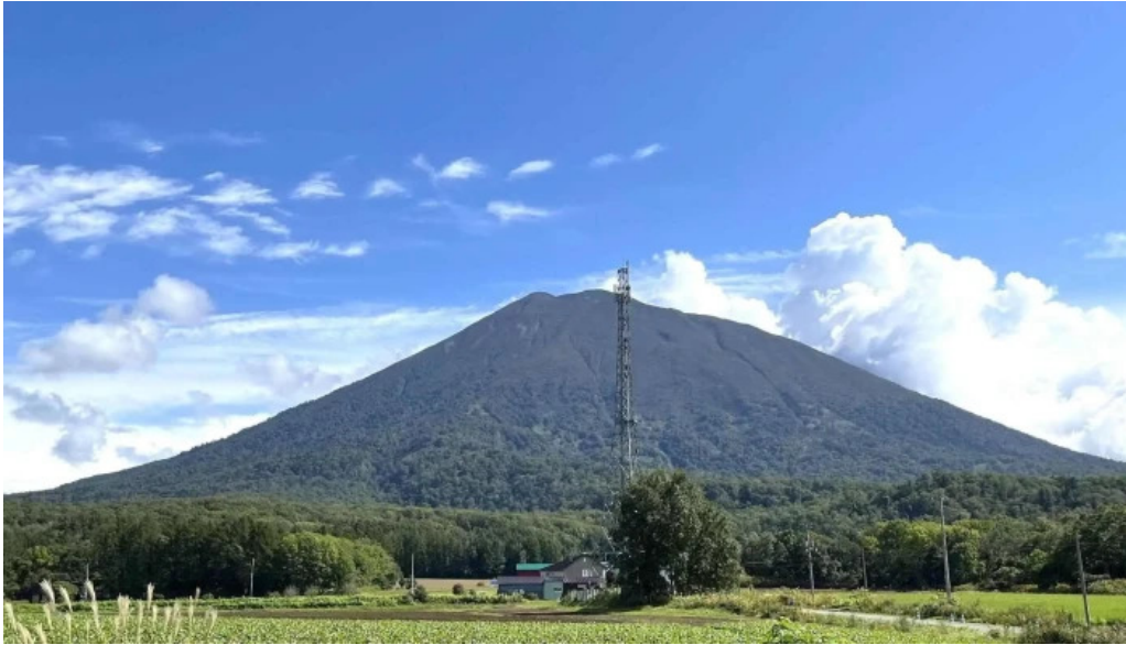
おうどんcafe 寶月 ホウツキ 写真