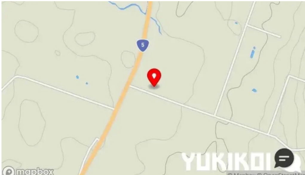
おうどんcafe 寶月 ホウツキ 地図