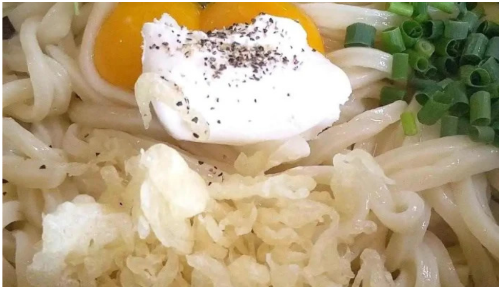
おうどんcafe 寶月 ホウツキ うどん