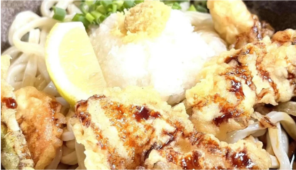
おうどんcafe 寶月 ホウツキ コメント