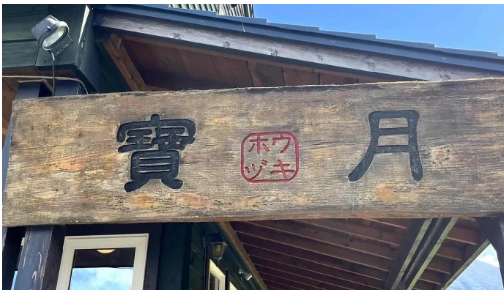
おうどんcafe 寶月 ホウツキ instagram