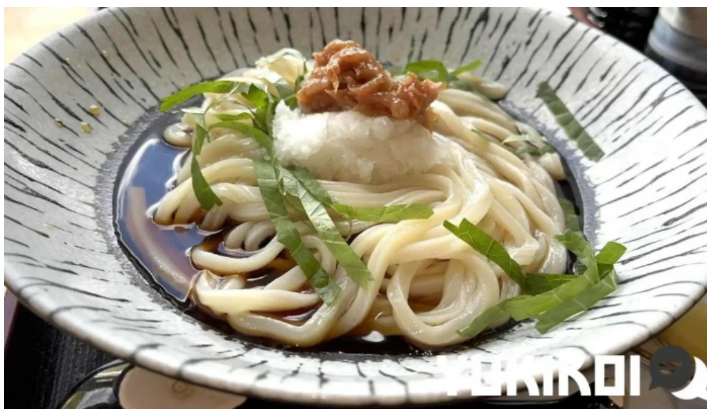
おうどんcafe 寶月 ホウツキ 料理飲み物