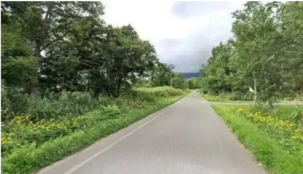
おうどんcafe 寶月 ホウツキ 倶知安町