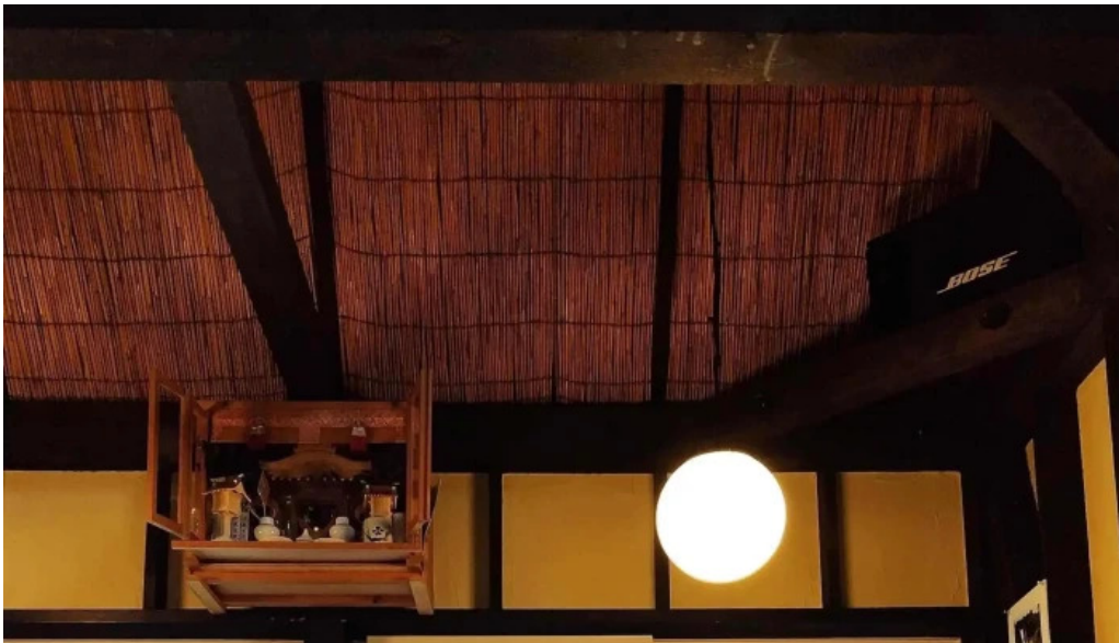
おうどんcafe 寶月 ホウツキ ウェブサイト